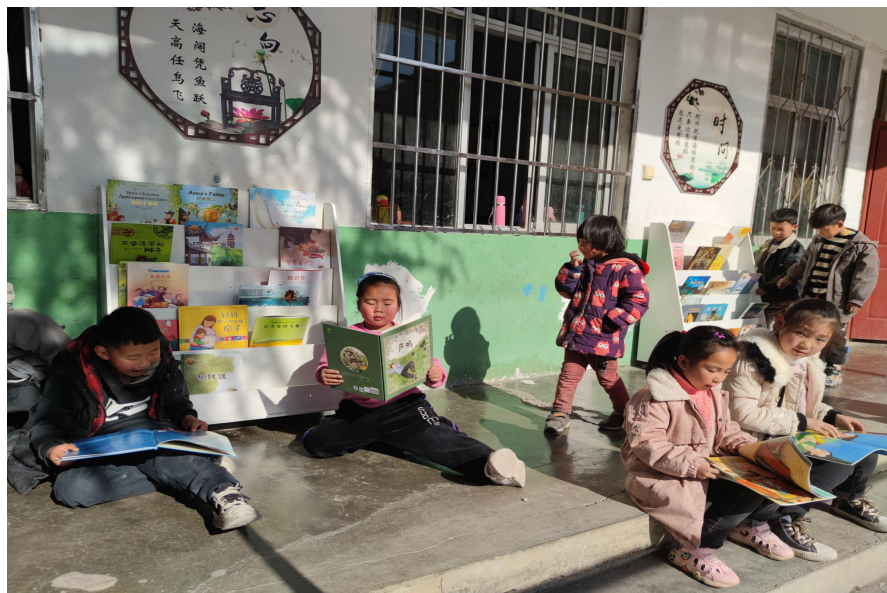
河南嵩县青山屯小学