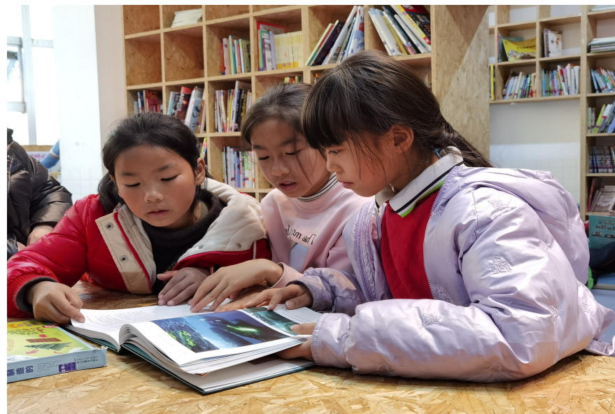
贵州罗甸县罗沙小学

2021年，在贵州、河南、湖南、湖北、山西、云南、甘肃、河北8个省实施项目83个，共计53114名乡村师生直接受益。