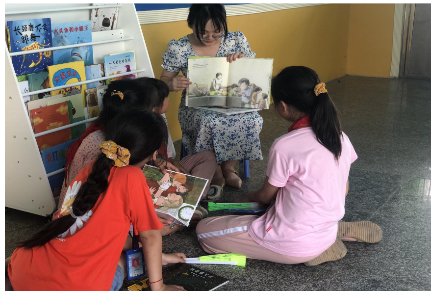
湖南保靖县如景小学