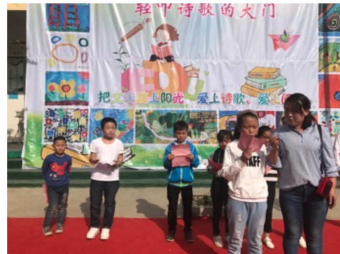
河南嵩县纸房小学：开展世界读书日主题活动，孩子们朗诵自己的作品