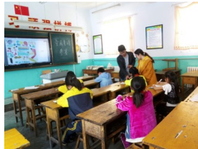
宁夏同心县张滩完全小学：教师指导童诗创作