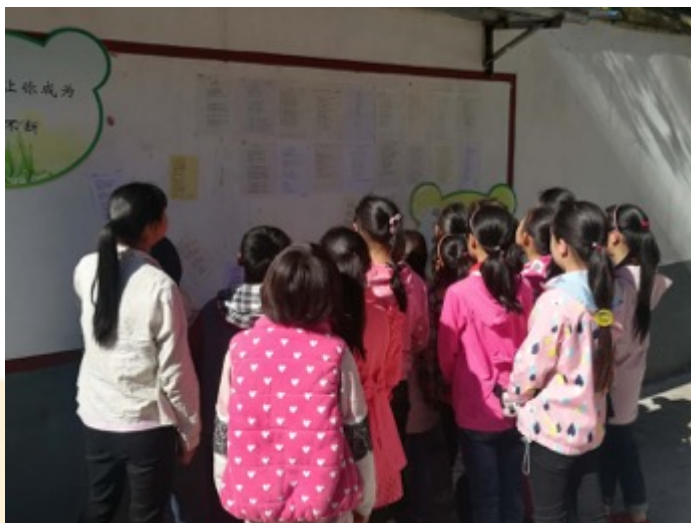
河南汝阳县玉马小学：全校童诗作品展览