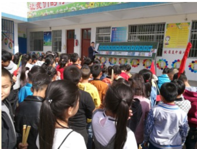
河南孟津县刘寨小学：学校开展童诗创作说明会