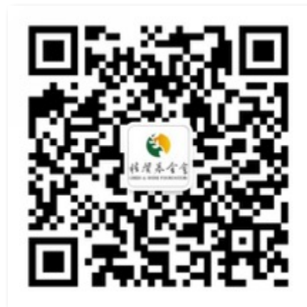
桂馨基金会微信公众号