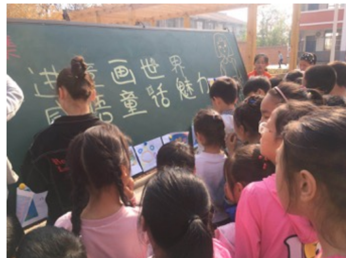
河南孟津县城东小学：孩子们在校园里创作童诗