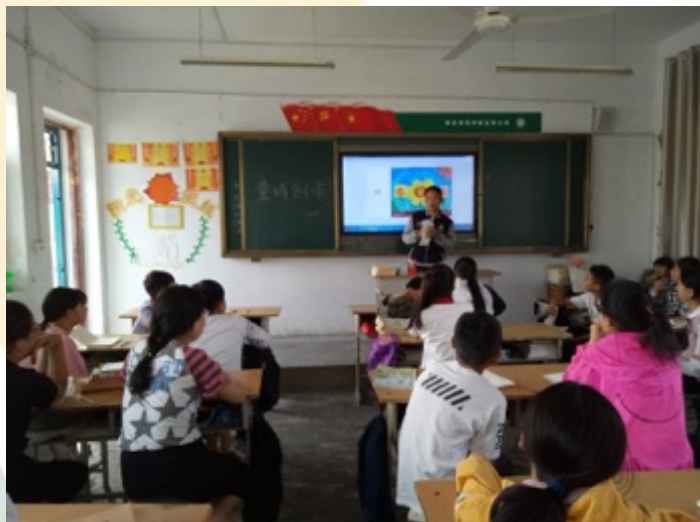
河南孟津县保障小学：班级童诗分享会