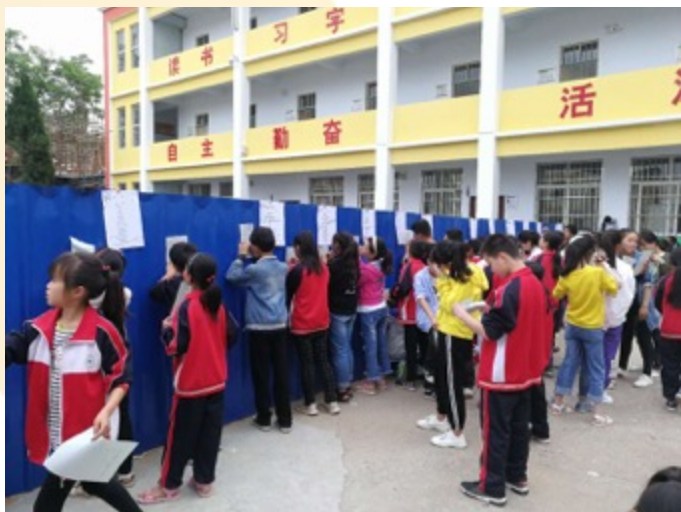
河南嵩县纸房镇中心小学：在校园里“作诗”