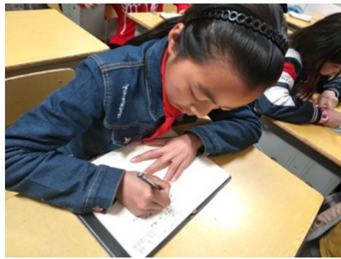
湖南保靖县野竹坪小学：学生认真创作童诗